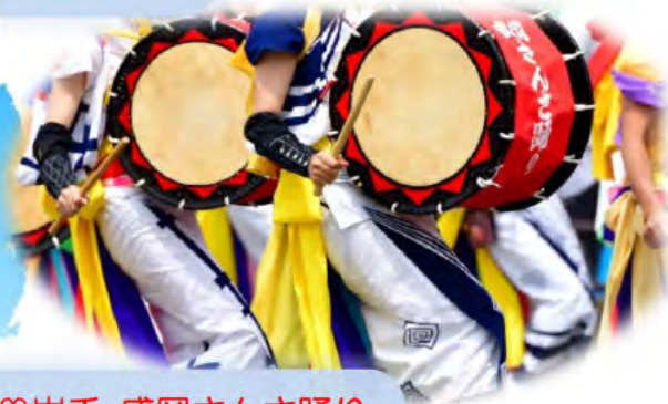
♡岩手 盛岡さんさ踊り